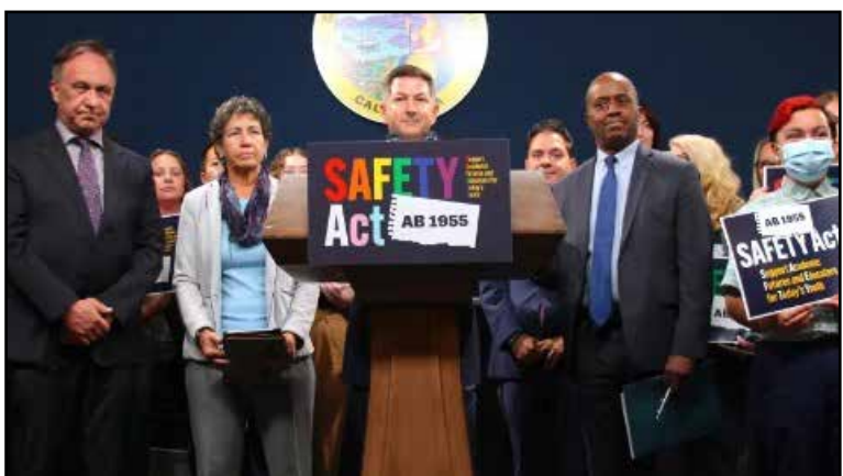
قانونگذاران کالیفرنیا در روز پنج شنبه ۲۳ می، تصویب لایحه جدیدی را که AB1955 نام دارد و جایگزین لایحه پیشین می شود، در دستور کار خود قرار دادند.

بر اساس نسخه اصلاح شده این لایحه که از سوی کریس وارد (Chris ward) نماینده دموکرات سن دیگو ارائه شده و «پشتیبانی از آینده آکادمیک» نام گرفته است و هدف آن تأمین امنیت نوجوانان می باشد، آموزگاران و مربیان مدارس اجازه نخواهند داشت که هویت جنسیتی و یا گرایش جنسی دانش آموزان را به خانواده هایشان اعلام نمایند و یا آنها را به این دلیل از مدرسه اخراج کنند.