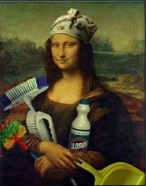
آمادگی مونالیزا برای خونه تکونی عید!

Can't find toilet paper anywhere? Introducing the Iranian solution to all bathroom problems: the aftabeh قنابه (Or just install a hand bidet spray, people!)