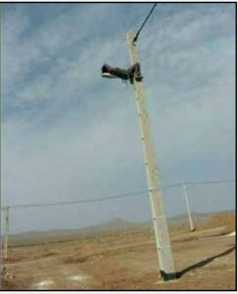
کرونا بعد از دیدن این صحنه دمش رو گذاشت رو کولش و رفت!

از قدیم میگفتن خر از قبرس میارن ... والا ما تو این چند روز اخیر یه چیزایی از ایران خودمون دیدیم که فکر کنم کلا می‌تونیم در آینده روش بعنوان یه درآمد غیرنفتی حساب کنیم. صادرات خر دو طبقه رینگ اسپرت قالپاق فابریک به قبرس! دیگه بسا وجود این هموطنان خر، نیازی به خر وارداتی از قبرس نداریم و با توجه به تعداد چشمگیر خران در سطح جامعه الخر در کشور، چشم انداز صادرات این موجودات چیزخل در آینده روشن به نظر می‌آید. حکایت از این قراره که بالاخره خرد و عقلا نیت در جمهوری اسلامی تا حدی بر خیریت مذهبی پیروز شد و علما راضی شدن بخاطر جلوگیری از شیوع کرونا، درب حرم امام رضا و حضرت معصومه در مشهد و قم بسته بشه اما یه سری خایه مال چیزخل کاسه داغ‌تر از آتش تجمع کردن و حتی در قم موفق شدن وارد صحن حرم هم بشن! بازه‌ترین قسمت داستان اینه که خبرگزاری‌های سپاه و حکومت این خر حزب‌اللهی رو عناصر مشکوک معلوم الحال وابسته به دژمنان دونستن. یعنی خودشون به خیریت خودشون حیرون موندن. یارو حیدر حیدر می‌کنه و میره دری رو میشکنه که رفیقای خودشون بستن. بفرما، اونوقت می‌خواین برین خر از قبرس بیارین؟