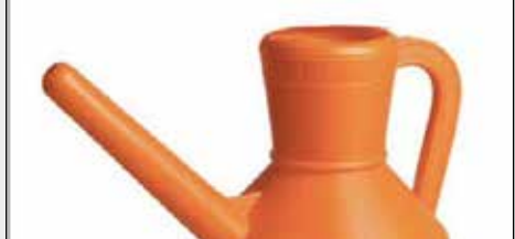
راه حل ایرانی برای جبران کمبود دستمال توال!

Can't find toilet paper anywhere? Introducing the Iranian solution to all bathroom problems: the aftabeh قنابه (Or just install a hand bidet spray, people!)